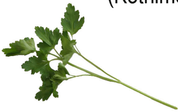
(Kothimeera Jati Kooru)